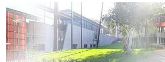
La salle du lycée Rosa Parks, moderne et accueillante.