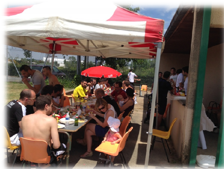
Week-end à St Pierre de Bœuf 2015