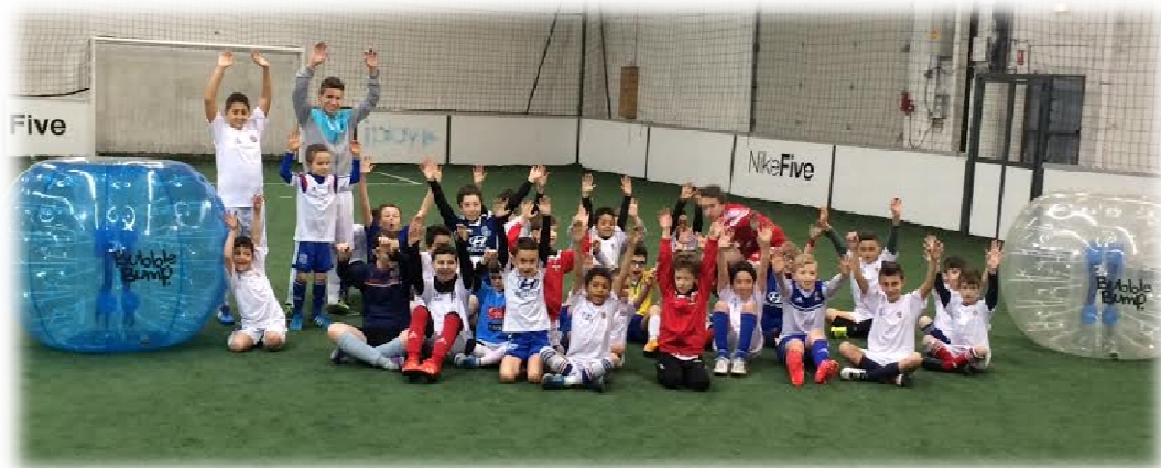
Tournois Bubble Foot pour les U11 et U13 à St Priest