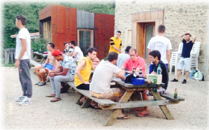
Mise au vert 2015 à St Remy sur Durolle