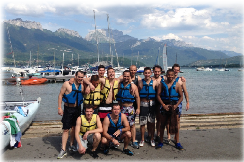
Week-end à Annecy Juin 2014

Chaque année, en fin de saison, le Président invite l'ensemble des dirigeants bénévoles et salariés à un week-end de « teambuilding ». Un moment idéal pour revenir sur la saison , pour fixer ensemble les objectifs de la saison à venir et surtout pour passer un moment convivial tous ensemble. L'ensemble des présidents de commission présentent leurs résultats et leurs attentes futures ... Des réunions et soirées sont organisées aussi plusieurs fois dans l'année pour les dirigeants .